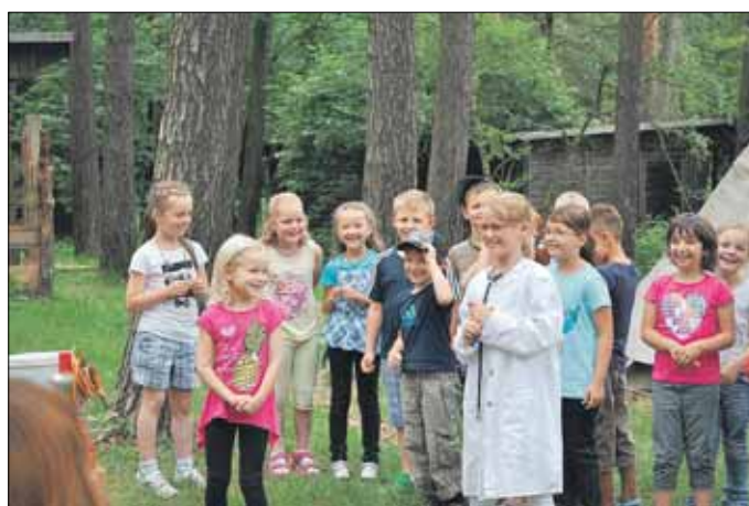
Programm vor den Eltern