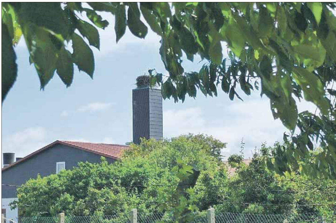
Storchenpaar im OT Außig