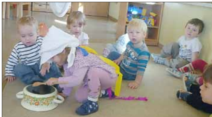
Topf-Klopfen in der Kinderkrippe