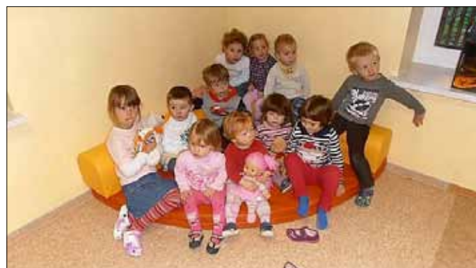
Die Lampertswalder Kinder nehmen zuerst die neue Kuschelecke in Besitz

Im Vorfeld haben Maler und Fußbodenleger für frische Farben auf Wand und Boden gesorgt und dafür sogar Teile Ihres Wochenendes geopfert. Recht herzlichen Dank dafür. Ebenso geht besonderer Dank an die Eltern, die es trotz großer organisato-