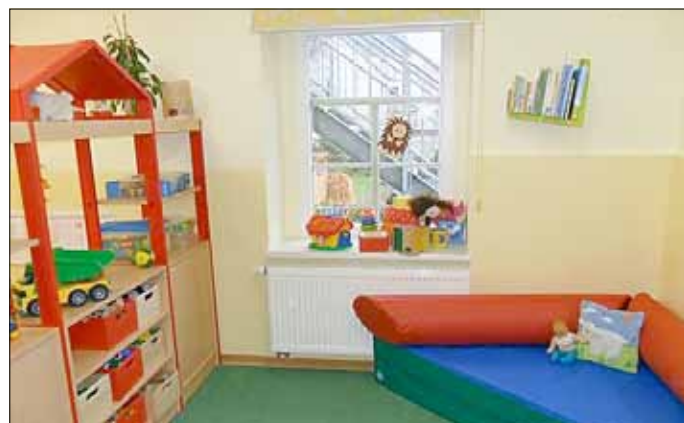
Ein Blick in die Cavertitzer Krippe

Über ein vorzeitiges Weihnachtsgeschenk ihrer Gemeindeverwaltung freuten sich die Krippenkinder in Cavertitz und Lampertswalde. Am Mittwoch, dem 07.11.2012 wurden in beiden Einrichtungen neue Möbel angeliefert und aufgebaut. Jetzt haben die Steppkes modern eingerichtete Zimmer in denen es sich noch besser spielen und lernen lässt.