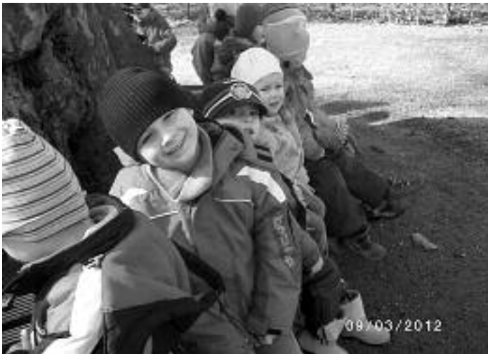
Pause auf der Bank