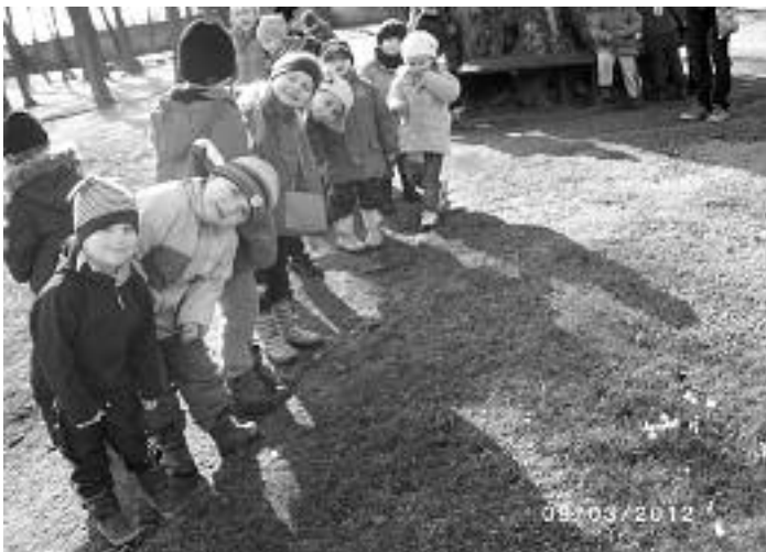
„Schneeglöckchen bist du da?“